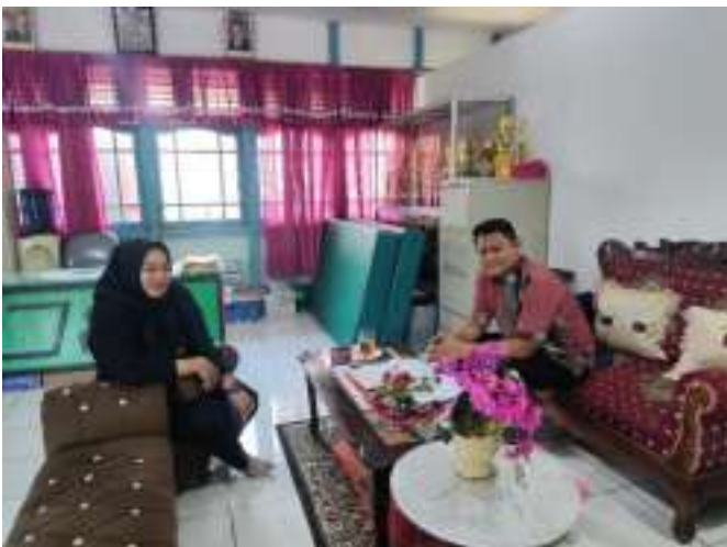
Pendampingan CSAN SDN 71 Pontianak Barat