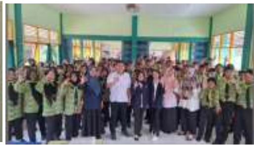
Sosialisasi Materi 3 R terhadap Kader Adiwiyata SMP N 17 Pontianak (Calon Adiwiyata Tingkat Provinsi)