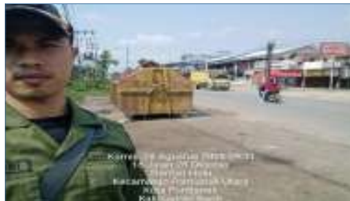
Dokumentasi Penjaga TPS diLokasi

Kegiatan ini merupakan penunjang kebersihan dan kestabilan kondisi sampah pada titik Tempat Penampungan Sementara (TPS). Kegiatan ini menyediakan tenaga kerja sebanyak 50 orang, 33 titik TPS dan 3 titik Depo sampah. Selain itu, kegiatan ini juga 50 orang berupa Pakaian kerja lapangan, jas hujan dan pengadaan Plank Larangan sebanyak 102 buah untuk dipasang di lokasi-lokasi tertentu yang banyak terjadi pelanggaran terkait penanganan sampah. Pekerja Penjaga TPS bekerja selama 8 (delapan) jam kerja. Pembayaran upah, BPJS Kesehatan dan Ketenagakerjaan Pekerja penjaga TPS dilakukan perbulan.