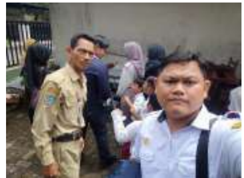
Pendampingan Calon Sekolah Adiwiyata Tingkat Mandiri 2025 di SDN 20 Pontianak Selatan