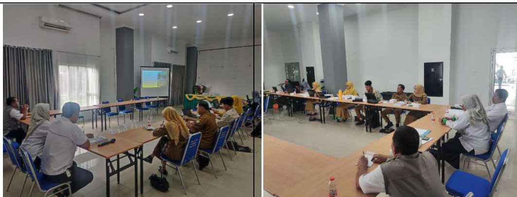
Pembahasan Pertek Asrama Haji Pontianak