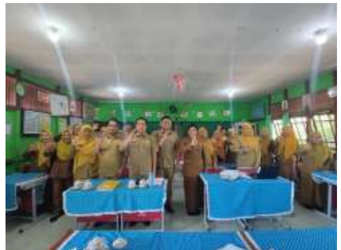
Pendampingan CSAM di SDN 27 Pontianak Timur