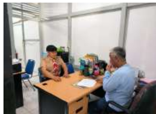
Kegiatan Ujian SKK dewan dan Anggota Saka Kalpataru 29 November 2025