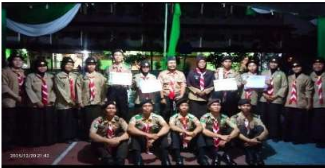
Kegiatan Orientasi dan Pengukuhan Calon Anggota Saka Kalpataru 20 Desember 2025