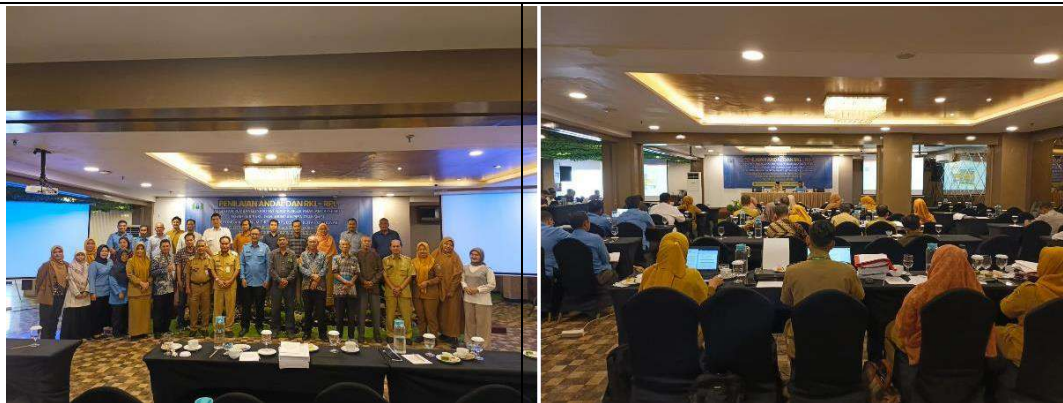
Pembahasan ANDAL dan RKL-RPL Pembangunan IPA PDAM