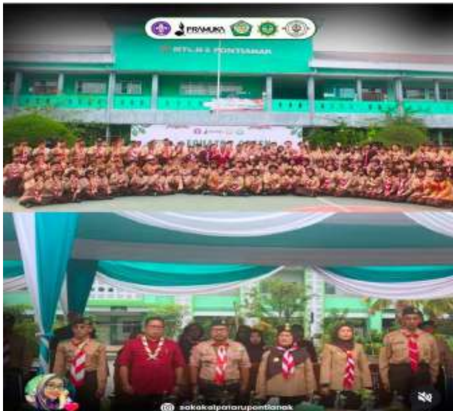
Kegiatan Lomba EGSC 3-4 Oktober 2025