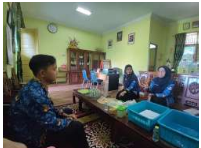
Pendampingan CSAN SDN 34 Pontianak Selatan