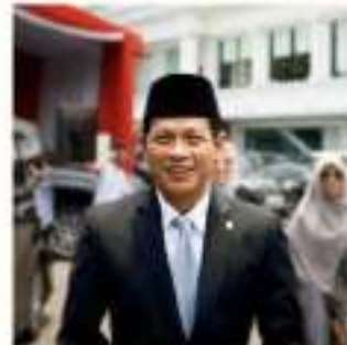
FOTO BERSAMA MENTERI LINGKUNGAN HIDUP RI Bapak Dr. Hanif Faisol Nurofiq, S.Hut., M.P., Ph.D

Penghargaan ini bukan sekadar simbol, tetapi amanah besar untuk memperkuat pendidikan lingkungan di sekolah. Saat ini kita tengah menghadapi tekanan iklim nyata, dan sekolah berperan strategis membentuk generasi peduli serta siap menghadapinya," ujar Hanif dalam sambutannya di Gedung Sasana Utama, TNIJ, Jakarta Timur.