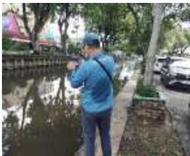
Dokumentasi kegiatan Penilaian Lokasi Pemantauan Adipura Kota Po