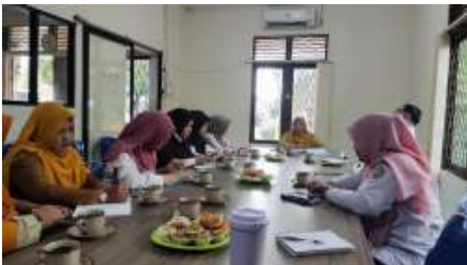
Rapat koordinasi bersama Kepala Sekolah calon usulan Adiwiyata tingkat Nasional Tahun 2025