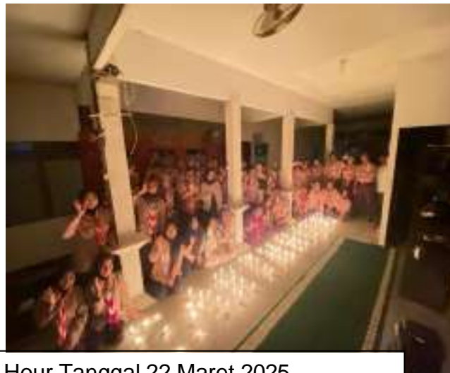
Kegiatan Peringatan Earth Hour Tanggal 22 Maret 2025