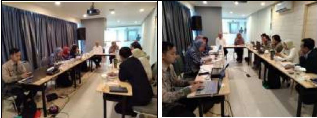
Pembahasan Dokumen Pertek Hotel Harris