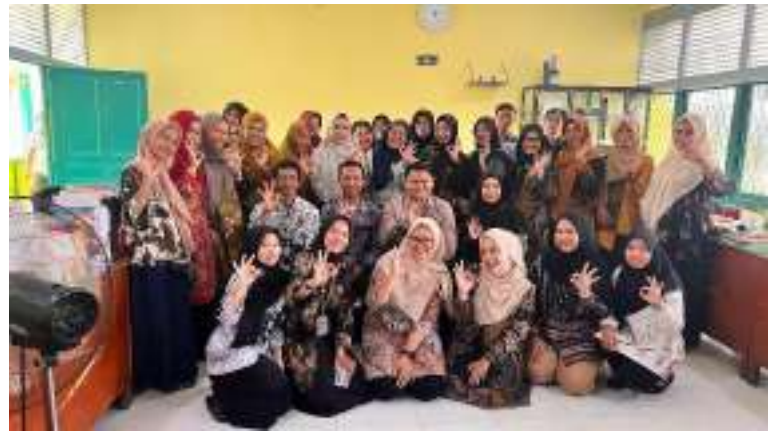
Pendampingan Calon Sekolah Adiwiyata Tingkat Provinsi 2025 di SMP N 17 Pontianak