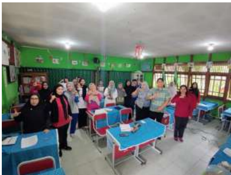
Pendampingan Calon Sekolah Adiwiyata Tingkat Mandiri 2025 di SDN 27 Pontianak Timur