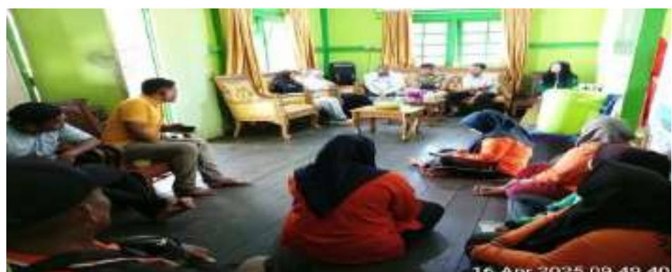
Dokumentasi rapat bersama PPSU UPT TPA Sampah dan Limbah