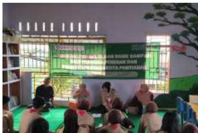
Kegiatan Edukasi Pengelolaan Bank Sampah Tanggal 8 Februari 2025