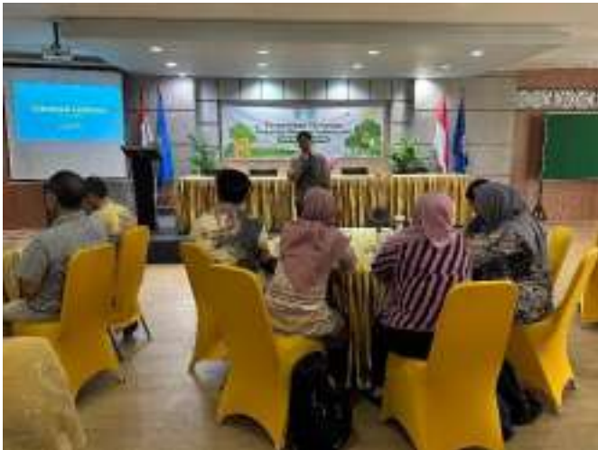
Pendampingan CSAM di SMK 5 PONTIANAK