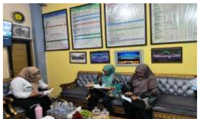
Pendampingan CSAN SDS Bawamai Pontianak