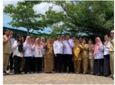
Pendampingan Calon Sekolah Adiwiyata Tingkat Provinsi 2025 di SDN 16 Pontianak Utara