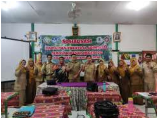
Pendampingan CSAM di SDN 20 Pontianak Selatan