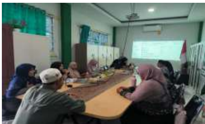
Pendampingan CSAN SDIT Al-Mumtaz Pontianak