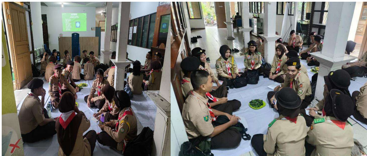
Kegiatan Pembagian Krida Tanggal 18 Januari 2025