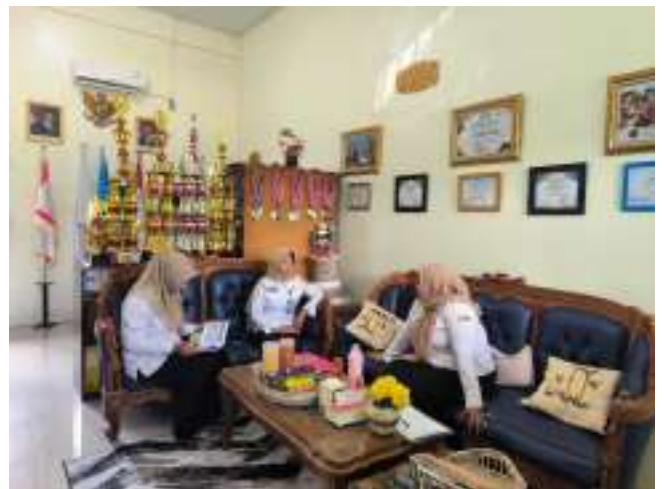
Pendampingan CSAM SDN 34 Pontianak Kota