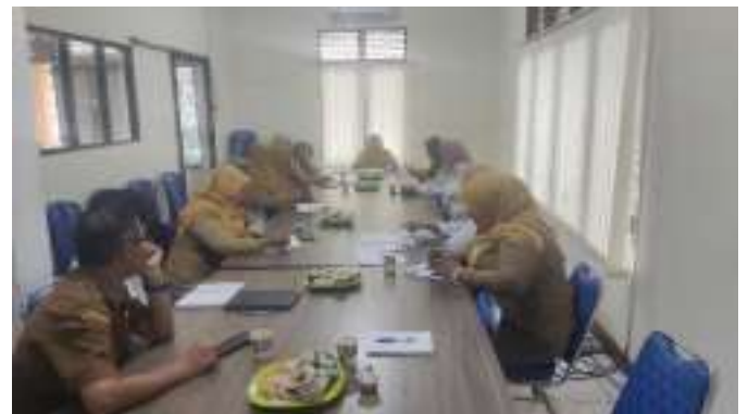
Rapat koordinasi bersama Kepala Sekolah calon usulan Adiwiyata tingkat Mandiri Tahun 2025